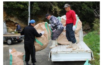
回収したゴミはトラックで港まで運びます