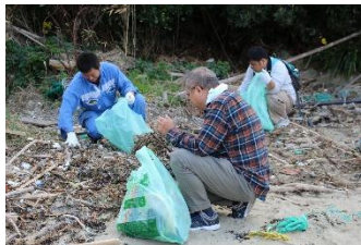
細かいゴミもできる限り丁寧に拾います