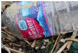
国内外を問わず様々なゴミが見られます