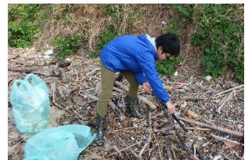
清掃活動スタート! 老若男女で力を合わせます