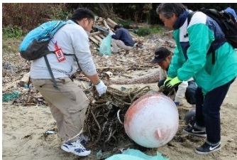
砂に埋もれたゴミもできる限り掘り起こします