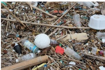
2ヶ月前に清掃した砂浜には既に沢山のゴミが。。

平成30年度 第3回 馬島清掃団(2018年11月18日実施) 参加者: 15名 回収量: 176kg