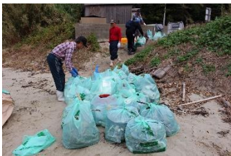
約50袋の量のゴミを回収しました