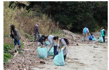
みんなで1時間程度活動を行いました