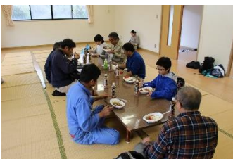
活動後は馬島産あかも入りの美味しいカレーを頂きました