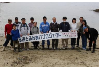
みなさまお疲れさまでした!